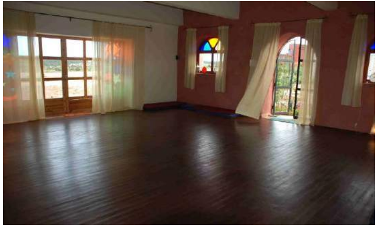
Salle pour le Yoga