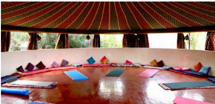
Yourte pour le Yoga